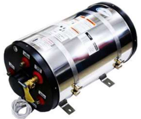
DTB-MP SERİSİ KROM SU ISITICI

•İstenen ölçü, voltaj ve özelliklerde özel ürün imalatı.