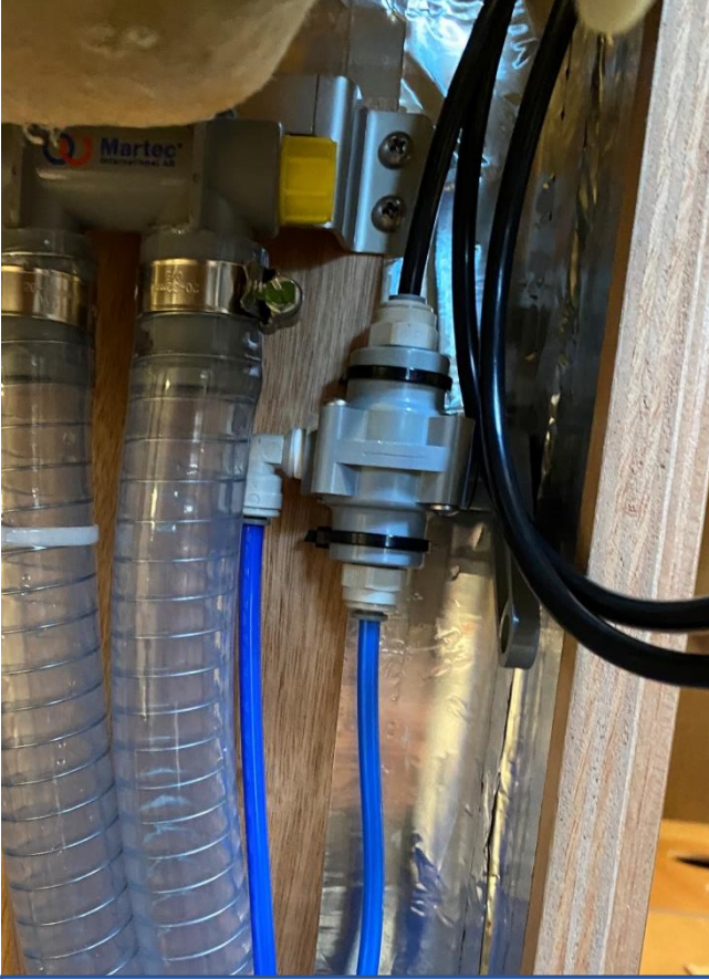
3 YOLLU VANA