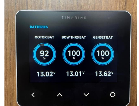
AKÜLERİN DOLULUK YÜZDESİ VE VOLTAJ SEVİYESİ