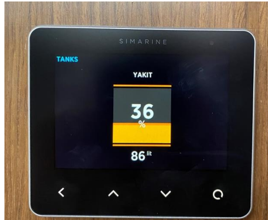
TEMİZ SU TANKI SEVİYESİ VE LİTRESİ