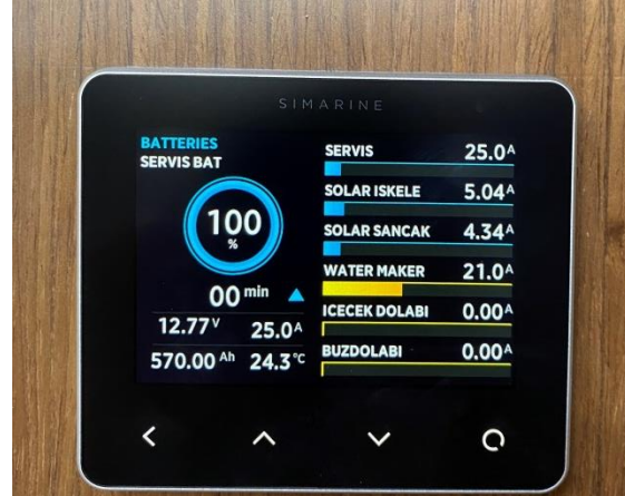
TÜKETİM VE ÜRETİM ANLIK AMPER TAKİBİ