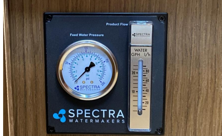
SUYUN BASINCI (PSI) VE ÜRETİM SUYU KAPASİTESİ (saat/litre) GÖSTERGESİ