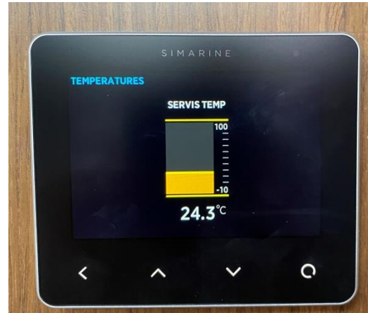
SERVİS AKÜ GRUBU SICAKLIĞI