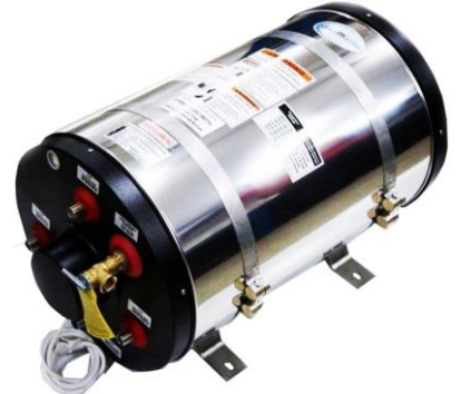
DTB-MP SERİSİ KROM SU ISITICI