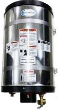
DTB-MP SERİSİ KROM SU ISITICI